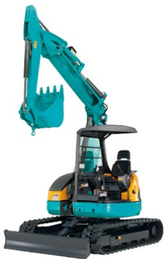
■作業範囲・外観寸法図 単位 (mm)