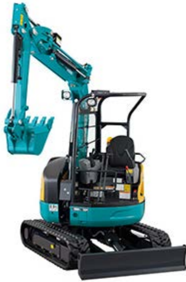
国土交通省第3次排出ガス対策型建設機械 超低騒音型建設機械