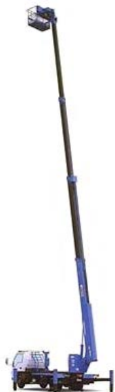
図1. バスケット作業範囲図