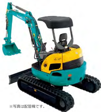
※写真は配管機です。