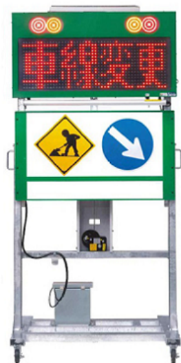
■格納時寸法 単位 (mm)