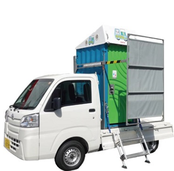
洋式便座 簡易水洗